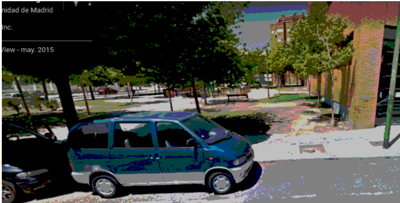
Google Mayo 2015

Este alcorque lleva vacío desde el 2015 y sigue así*.