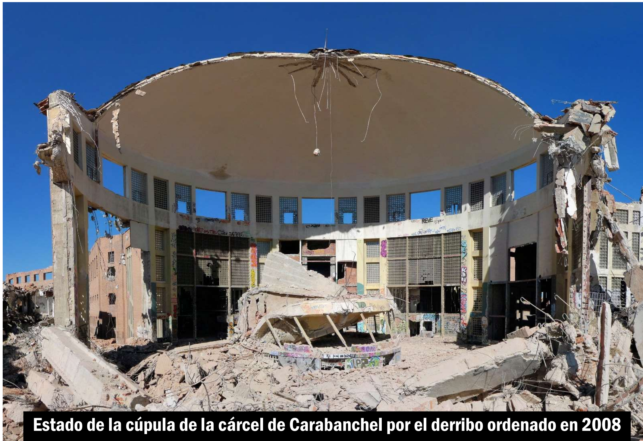
Estado de la cúpula de la cárcel de Carabanchel por el derribo ordenado en 2008